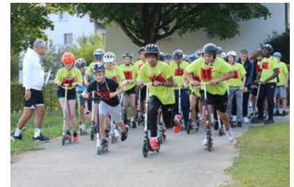
Einsatz am Gigathlon 20

Die Unsicherheit, wie sich Corona auf den Lehrstellenmarkt auswirken wird, ist überall gross. Firmen und Unternehmen sind momentan sehr zurückhaltend mit Tag der offenen Türen und Schnupperangeboten. Private Netzwerke, „Vitamin B“, sind nun um so wertvoller. Tauschen Sie sich als Eltern aus, bieten Sie Möglichkeiten an, dass Jugendliche einen Einblick in die Berufswelt erhalten können, fragen Sie, wenn Sie und Ihre Tochter, Ihr Sohn Unterstützung braucht. Gemeinsam geht es besser.